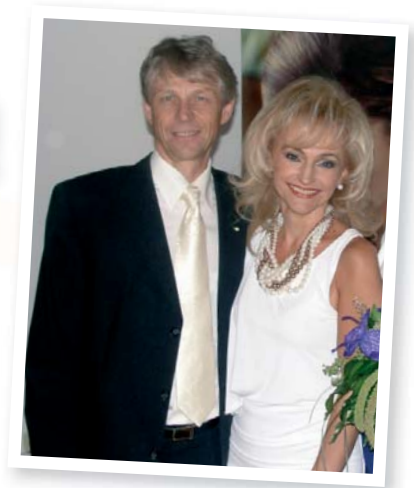
CSAPATUNK NEVÉBEN IS, ÉLETFA CSALÁD!

ALKOTÓ, ÉRTÉKTEREMTŐ, SZERETETBEN, EGÉSZSÉGBEN GAZDAG, BOLDOG ÚJ ÉVET KÍVÁUNK A