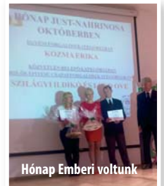
Hónap Embere voltunk

HISZEK A MUNKÁNKBAN. HISZEK AZ IDŐ BIZONYÍTÓ EREJÉBEN. HISZEK A MEGTEREMTETT ÉRTÉKEINKBEN. HISZEK A PÉLDA EREJÉBEN. HISZEK A JELENÜNKBEN, ÉS HISZEK A JÖVŐNKBEN.