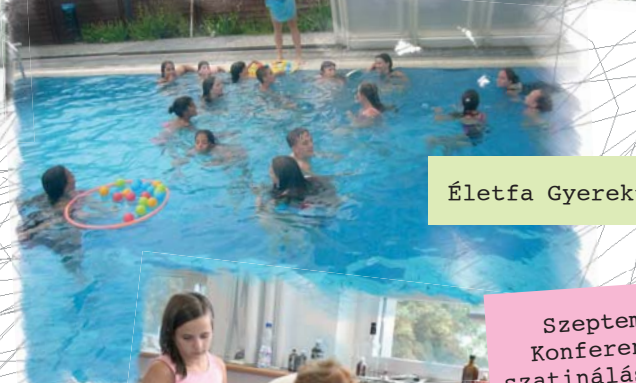
Szeptemberi Konferencia – szatinálás, váza- készítés