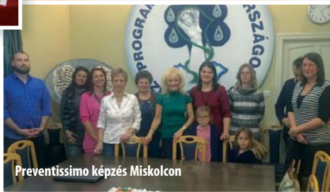
Preventissimo képzés Miskolcon

tosan a 2015 –ös Jubileumi évünk eredményeire alapozva, még csodálatosabbnak nézhetünk elébe! Büszkék vagyunk