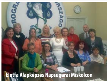
Életfa Alapképzés Napsugarai Miskolcon

Pezseg a klubéletünk is országszeret! Zsúfolásig megtelnek a képzési termeink! A Debrecenben, Miskolcon és Budapesten folyó munkánk eredményeként új 3, 6,